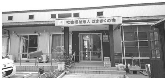
グループホーム ドリーム

グループホーム（GH）とは、地域で自立した生活を送るための共同住居です。対象は、ある程度身の回りのことはできるけれど、1人で生活するのは「難しい」、「心配だ」、「自信がない」、という精神障がいを持っている方です。